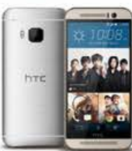
4G 月付999/1,099* 手機 $4,990