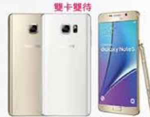
4G 月付1,399/1,499* 手機 $7,990