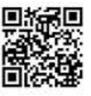
手機掃描 QR Code 手機優惠方案

貼心提醒：一、專案優惠：1. 3G/4G系列方案優惠期間至民國105年1月31日止。2. 中辦30日付100/300或4G月付599實價之手機專案優惠期約24個月，並取店指定機款且預購。詳細資費內容請依台灣之單官網公告為準。二、攜碼用戶優惠：1. 攜碼中辦4G 月付599實價方案續約24個月，並持移入門號之最近三期內500元以上實體帳單正本，可享免預繳優惠。三、其他說明：1. 所有專案，提前終止租約均需繳納補償金。如無購機、預繳規定及內容以申請現場優惠專案向專員索取為準。2. 以上實價或優惠內容僅限國內使用。當月未用完之餘額除另有約定外不可折抵現金亦不可遞延至次月使用。國際漫遊依標準通話費率另行計算。3. 因行動通帳及上網品質會隨地形、氣候、建物遮蔽、使用人數及地點等造成影響，故不保證精確。本公司目前提供900MHz頻段4G服務，若上網地點無法支援台灣之4G或3.74G行動寬頻網路，將自動轉為3G網路。連線速度降低但期間所產生的用量，仍須以原申請的實單計算。涵蓋範圍及供裝區域請洽門市或官網。4. 台灣之星保留修改、終止或暫停本活動之權利。更多詳情請參閱台灣之星網站公告。或洽台灣之星全台門市及24小時服務專線：用戶手機直撥123(免費)或0908-000123(行動計費)。