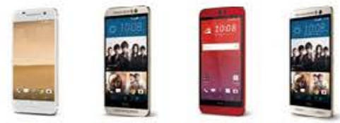
HTC ONE X9 HTC ONE M9 HTC Butterfly 3 HTC ONE M8s