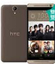
4G 月付799/899* 手機 $1,490