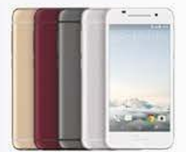
4G 月付999/1,099* 手機 $6,990