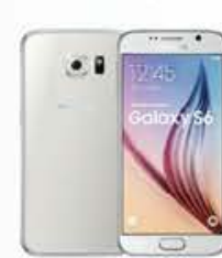
4G 月付1,399/1,499* 手機 $4,990