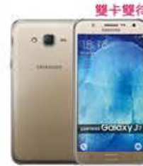
4G 月付799/899* 手機 $990