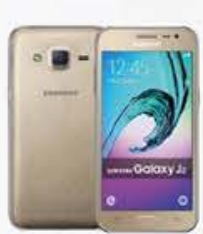
4G 月付799/899* 手機 $0

攜碼申辦4G 1,399，以上方案，搭配三星 4G LTE 指定手機，享手機價最高減4,000元