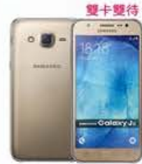
4G 月付799/899* 手機 $490