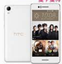
4G 月付799/899* 手機 $990

攜碼申辦4G 799 / 899 / 999 / 1,099資費方案，搭配 HTC 指定手機，享手機價最高減1,000元