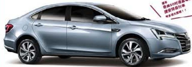
頭獎 LUXGEN S5 Turbo ECO Hyper 1.8T 雅緻型 (價值NT$659,000)